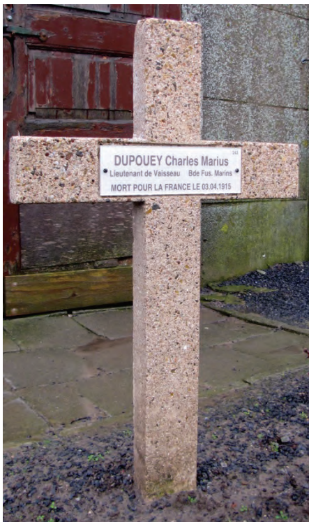
Graf van Charles Dupouey te Woesten