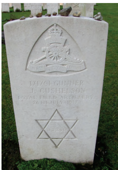
Russisch gevangene op Adinkerke Military Cemetery

Alleen bij de Britten vind je zgn. ' Missing memorials '. Niet alleen voor de 'vermisten' (de echte 'missing'), maar ook voor de 'onbekenden' die begraven liggen onder een grafsteen (en dus strikt genomen niet 'missing' zijn). Bekend zijn de Menenpoort (ca. 55.000 namen van vóór 15 aug. 1917), Tyne Cot Memorial (ca. 35.000), Ploegsteert (11.000, normaal voorzien te Rijsel) en de aparte voor Nieuw-Zeelanders (Zonnebeke, Mesen). Minder bekend is het Nieuport Memorial , dat 566 namen herdenkt, vooral van juli 1917.