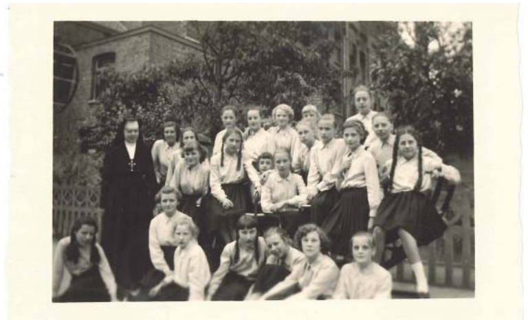
Burgerschool Roeselare 39