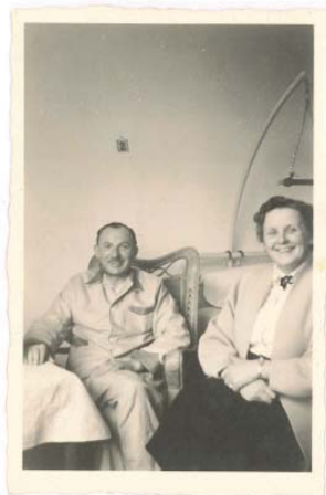
Mijn overgrootvader in het ziekenhuis te Torhout n.a.v. zijn ongeval 34